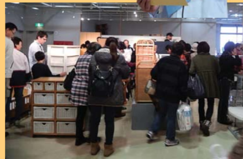
再生品展示販売コーナー

正解 ○ 牛や米を育てる時に使用される水が大量にある。それは仮想水(ヴァーチャルウォーター)と呼ばれ、見えないところに水が使用されています。