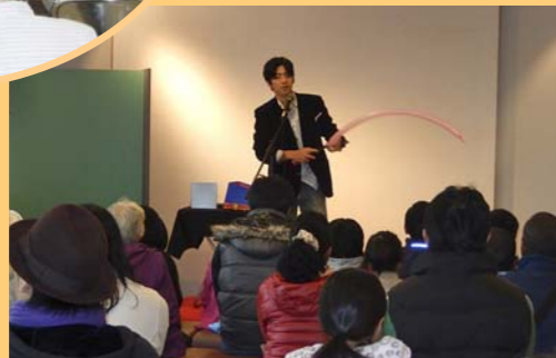
マジシャンよっしーのマジックショー